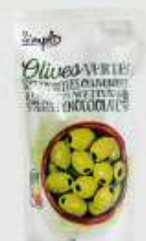
OLIVES VERTES DÉNOYAUTÉES 320G