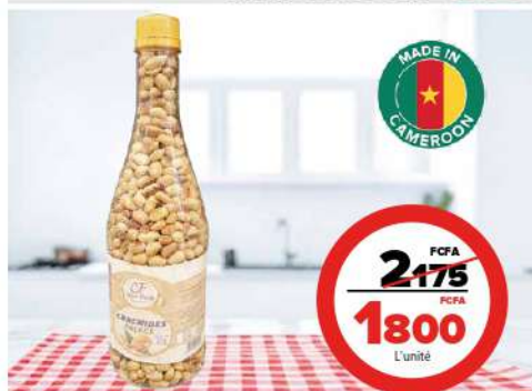
ARACHIDE ENROBÉ TWINSLOOK 450G