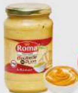
MOUTARDE ROMA 1KG