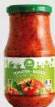
SAUCE TOMATES BASILIC CARREFOUR 420G