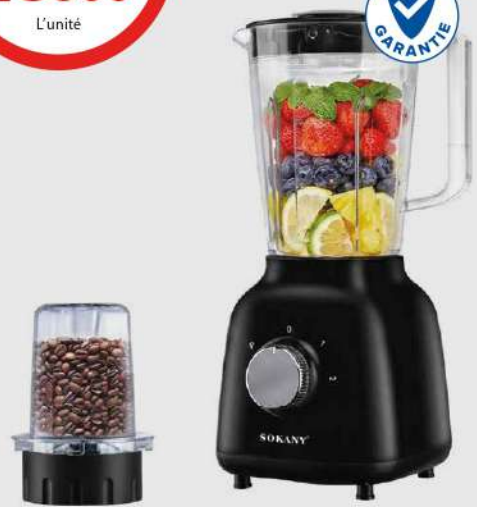
BLENDER 2EN1 SOKANY 500W