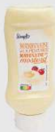
MAYONNAISE À LA MOUTARDE 470G