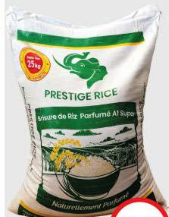
RIZ BRISURE PARFUMÉ PRESTIGE 25KG