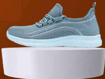
BASKET FEMME (ROSE, GRISE)