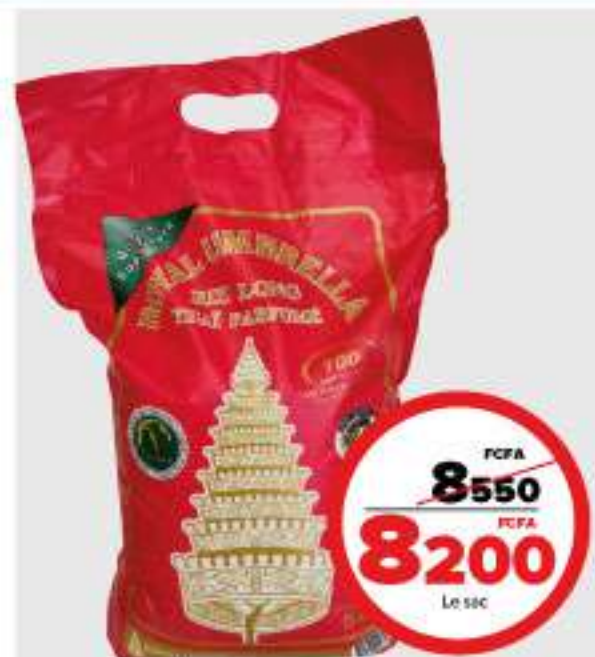
RIZ THAI ROYAL UMBRELLA 5KG