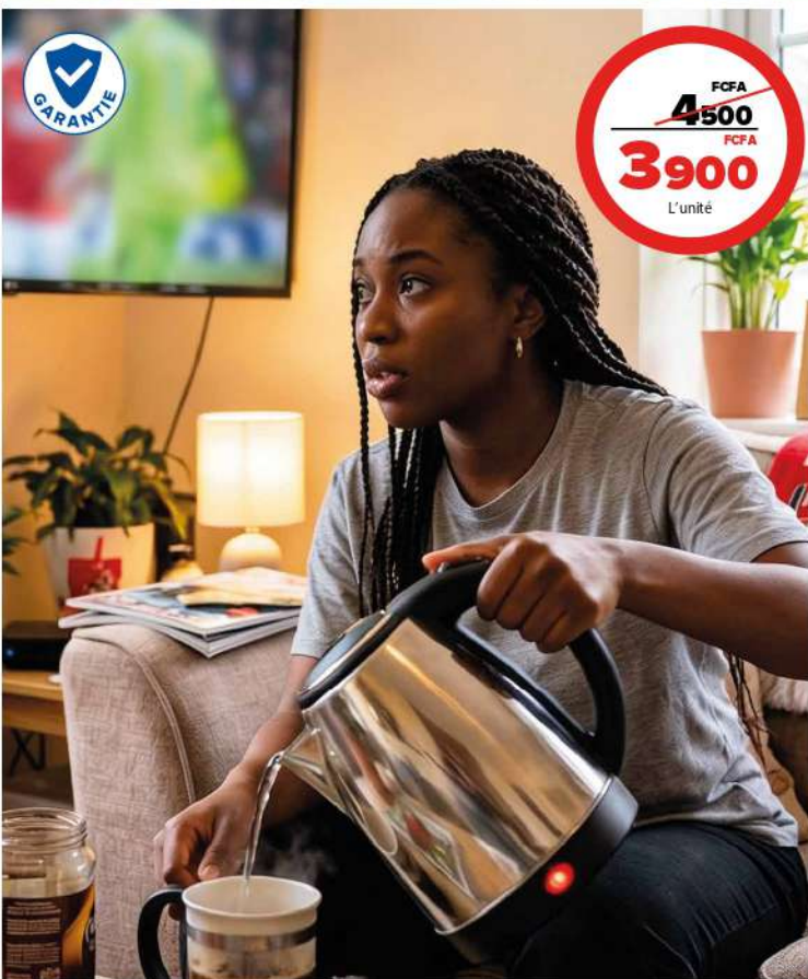
BOUILLLOIRE SEBEDORIA 2L