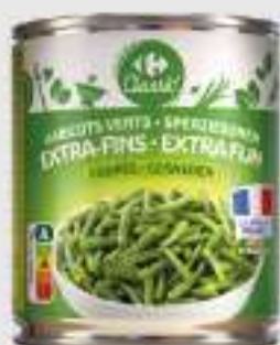
HARICOTS VERTS EXTRA FINS CARREFOUR 1/2