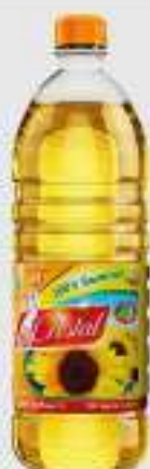
HUILE DE TOURNESOL CRISTAL 1L