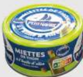
MIETTES DE THON À L'HUILE D'OLIVE 160G