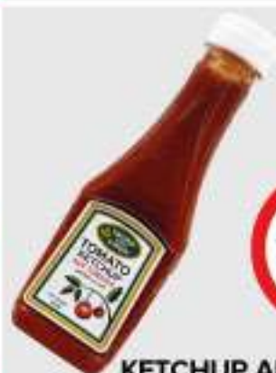
KETCHUP ANKIT 340G