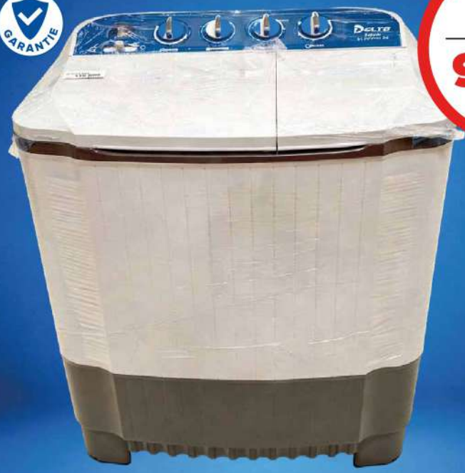
MACHINE À LAVER SEMI-AUTO DELTA 7KG