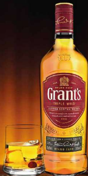
WHISKY GRANTS + 01 VERRE 75CL